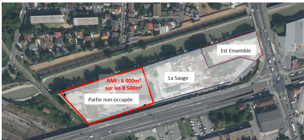
Figure 1 : périmètre de l'AMI

Image satellite avec localisation du site :